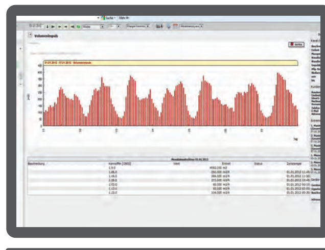
Lastgang Wasser mit Messdatenabschluss