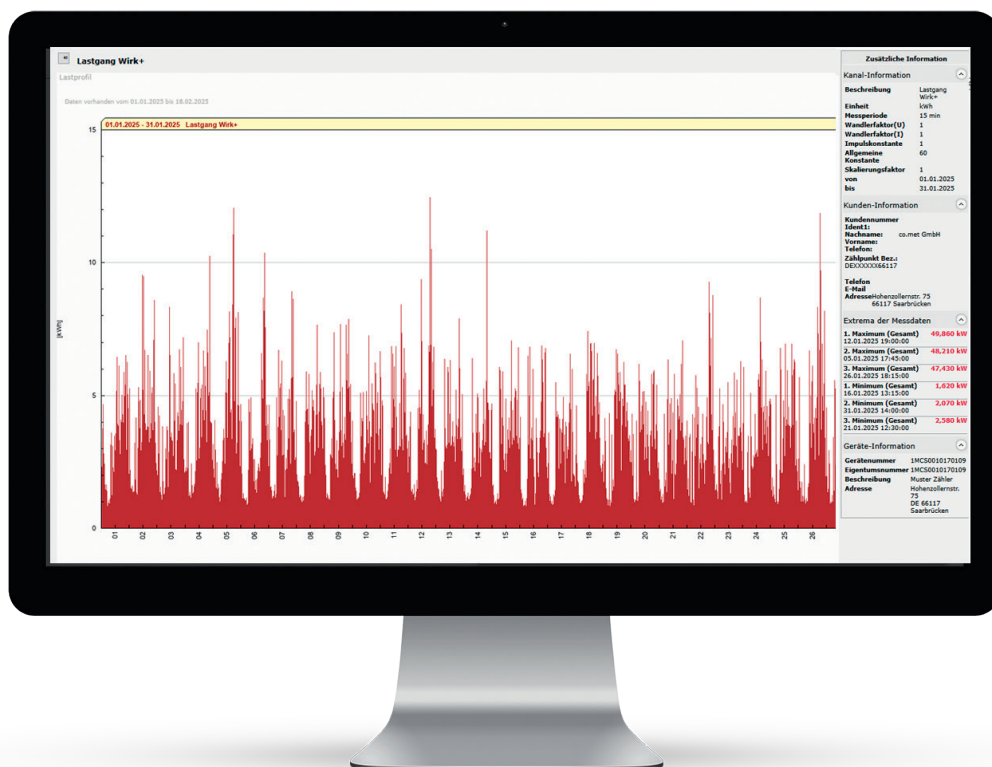
Visualisierungs-Portal: Jederzeit den Energieverbrauch im Blick

QR-Code scannen und online mehr über unsere Lösung erfahren.